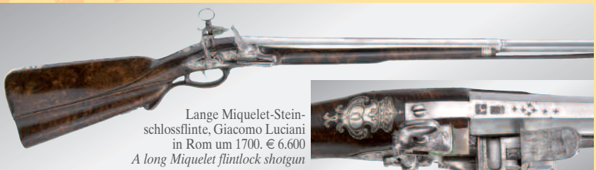
Lange Miquelet-Steinschlossflinte, Giacomo Luciani in Rom um 1700. € 6.600 A long Miquelet flintlock shotgun