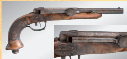
Dreyse Zündnadel-Vorderladerpistole Nr.2 um 1828. € 4.500 A Dreyse needle-fire front-loading pistol no.2, circa 1828