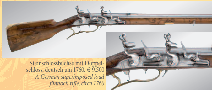
Steinschlossbüchse mit Doppelschloss, deutsch um 1760. € 9.500 A German superimposed load flintlock rifle, circa 1760