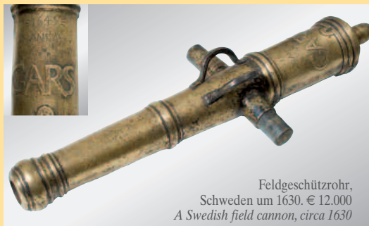
Feldgeschützrohr, Schweden um 1630. € 12.000 A Swedish field cannon, circa 1630