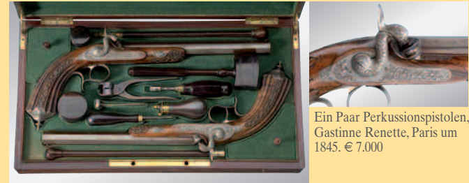
Ein Paar Perkussionspistolen, Gastinne Renette, Paris um 1845. € 7.000