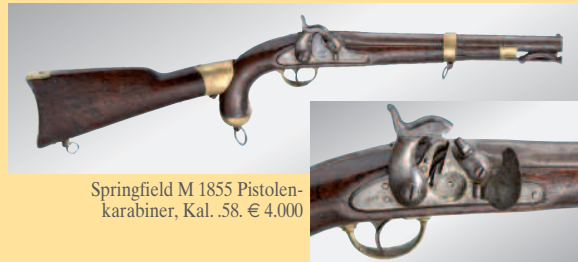
Springfield M 1855 Pistolenkarabiner, Kal. .58. € 4.000