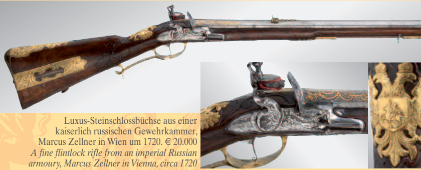
Luxus-Steinschlossbüchse aus einer kaiserlich russischen Gewehrkommer. Marcus Zellner in Wien um 1720. € 20.000 A fine flintlock rifle from an imperial Russian armoury, Marcus Zellner in Vienna, circa 1720