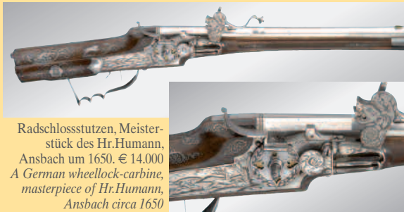
Radschlossstutzen, Meisterstück des Hr.Humann, Ansbach um 1650. € 14.000 A German wheellock-carbine, masterpiece of Hr.Humann, Ansbach circa 1650