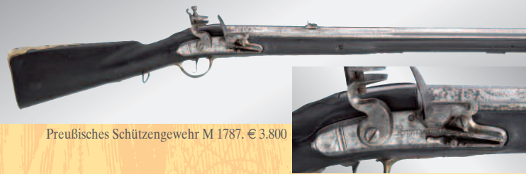
Preußisches Schützengewehr M 1787. € 3.800