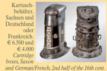
Kartuschenbehälter, Sachsen und Deutschland oder Frankreich. € 6.500 und € 4.000 Cartridge boxes, Saxon and German/French, 2nd half of the 16th cent.