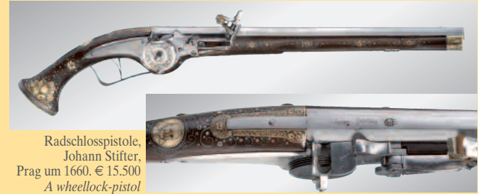
Radschlosspistole, Johann Stifter, Prag um 1660. € 15.500 A wheellock-pistol