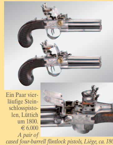
Ein Paar vierläufige Steinschlosspistolen, Lüttich um 1800. € 6.000 A pair of cased four-barrell flintlock pistols, Liège, ca. 1800