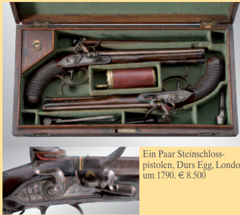
Ein Paar Steinschlosspistolen, Durs Egg, London um 1790. € 8.500