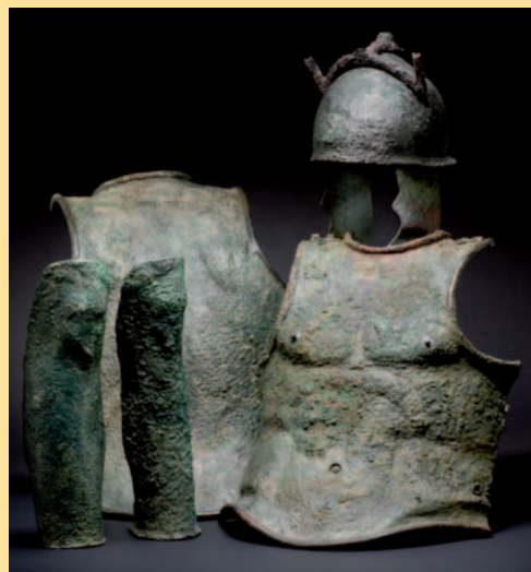
Etruskisch-griechische Rüstung, 4./3. Jhdt. v. Chr. € 15.000 A set of Greek-Etruscan armour, 4th/3rd cent. B.C.