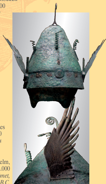
Italischer Pilos Helm, 4./3. Jhdt. v. Chr. € 16.000 An Italic pilos helmet, 4th/3rd century B.C.