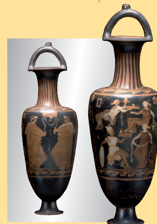
Kampanische Amphora, 4. Jhdt. v. Chr. € 2.500 A Campanian amphora, 4th century B.C.