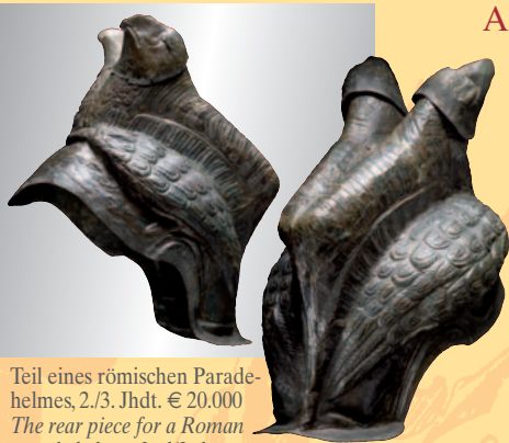
Teil eines römischen Paradehelmes, 2./3. Jhdt. € 20.000 The rear piece for a Roman parade helmet, 2nd/3rd century