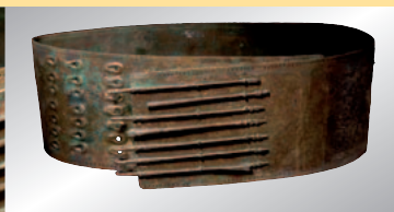
Samnitischer Bronzegürtel, 4./3. Jhdt v. Chr. € 1.800 A Samnite bronze belt, 4th/3rd century B.C.