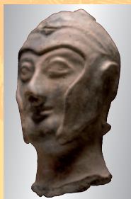
Etruskischer Terrakottakopf eines Kriegers, 5. Jhdt. v. Chr. € 2.000 An Etruscan terracotta warrior's head, 5th century B.C.