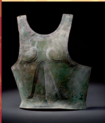
Brustplatte eines griechischen Glockenpanzers, 6./5. Jhdt. v. Chr. € 12.000 A breastplate for a Greek bronze cuirass, 6th/5th century B.C.