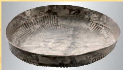
Römische Silberschale, 1./2. Jhdt. € 1.500 A Roman silver bowl, 1st/2nd century