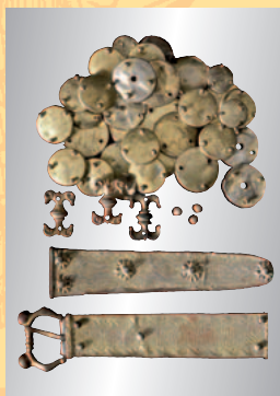
Ritterlicher Prunkgürtel, deutsch oder französisch, 14. Jhdt. € 4.000 A splendid German or French knightly belt, 14th century