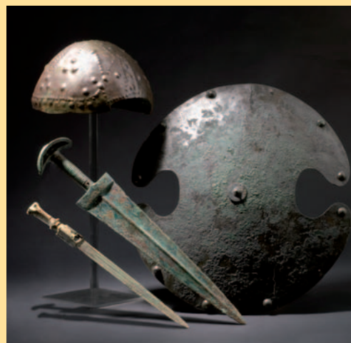
Antiken aus dem Nahen Osten und dem Orient Antiquities of the Middle East and the Orient