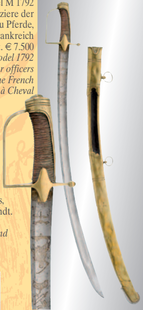
French carabinier officers, mid 19th century

Helm und Kürass für einen Offizier der fran- zösischen Carabiniers, Mitte 19. Jhdt. € 12.000 A helmet and cuirass for